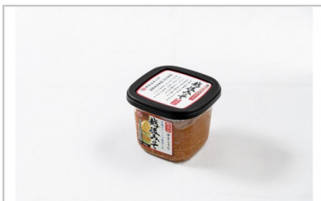
越後みそ8ケ入セット