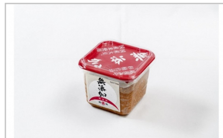
上越浮きこうじみそセット