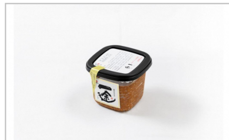
丸久こだわりセット