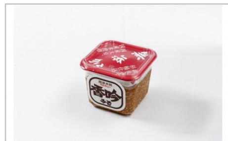
天然醸造香吟みそ6ケ入セット