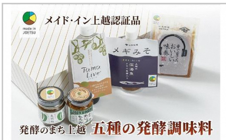
専門店おすすめ！贅沢五種の発酵調味料 セット★メイト・イン上越認証品★…