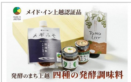
発酵のまち上越 四種の発酵調味料