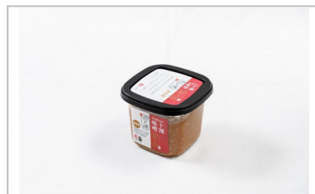
新之助仕込十割みそ4ケ入セット