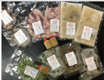
深山のめぐみ「山菜うま煮と鯉料理」