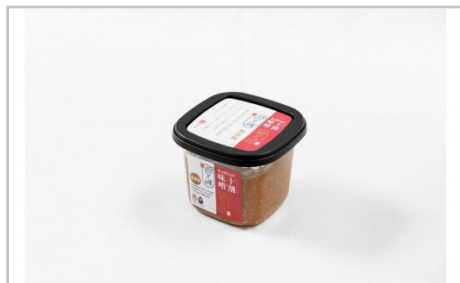
新之助仕込十割みそ6ケ入セット