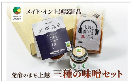
発酵のまち上越 三種の味噌セット