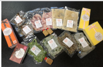
牧の深山豪華セット