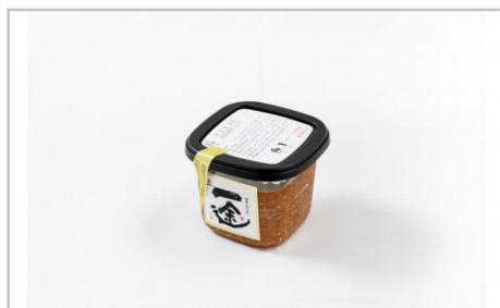
一途・新之助みそ4ケ入セット