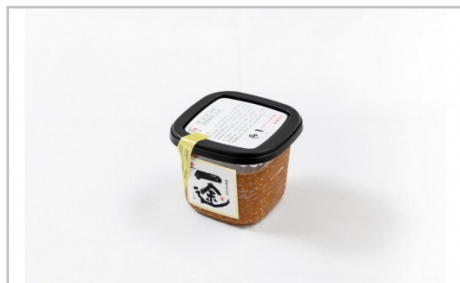
丸久おすすめセット